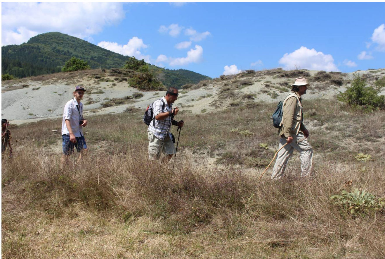
Εικαστική Πορεία 2016: στη Διαδρομή της Μεγάλης Πορείας (21 Αυγούστου)

-Το Τοπίο ως ετερότητα, το Τοπίο ως ύλη, το Τοπίο ως Πεδίο