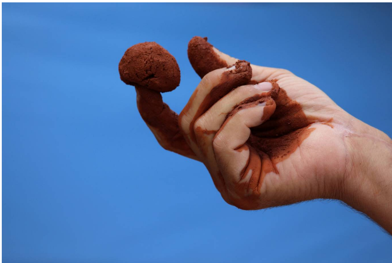
Το χέρι κι ο πηλός Εικαστική Πορεία 2017

Καλλιτεχνικός/Επιστημονικός Υπεύθυνος: Γιάννης Ζιώγας, αναπληρωτής καθηγητής ΤΕΕΤ