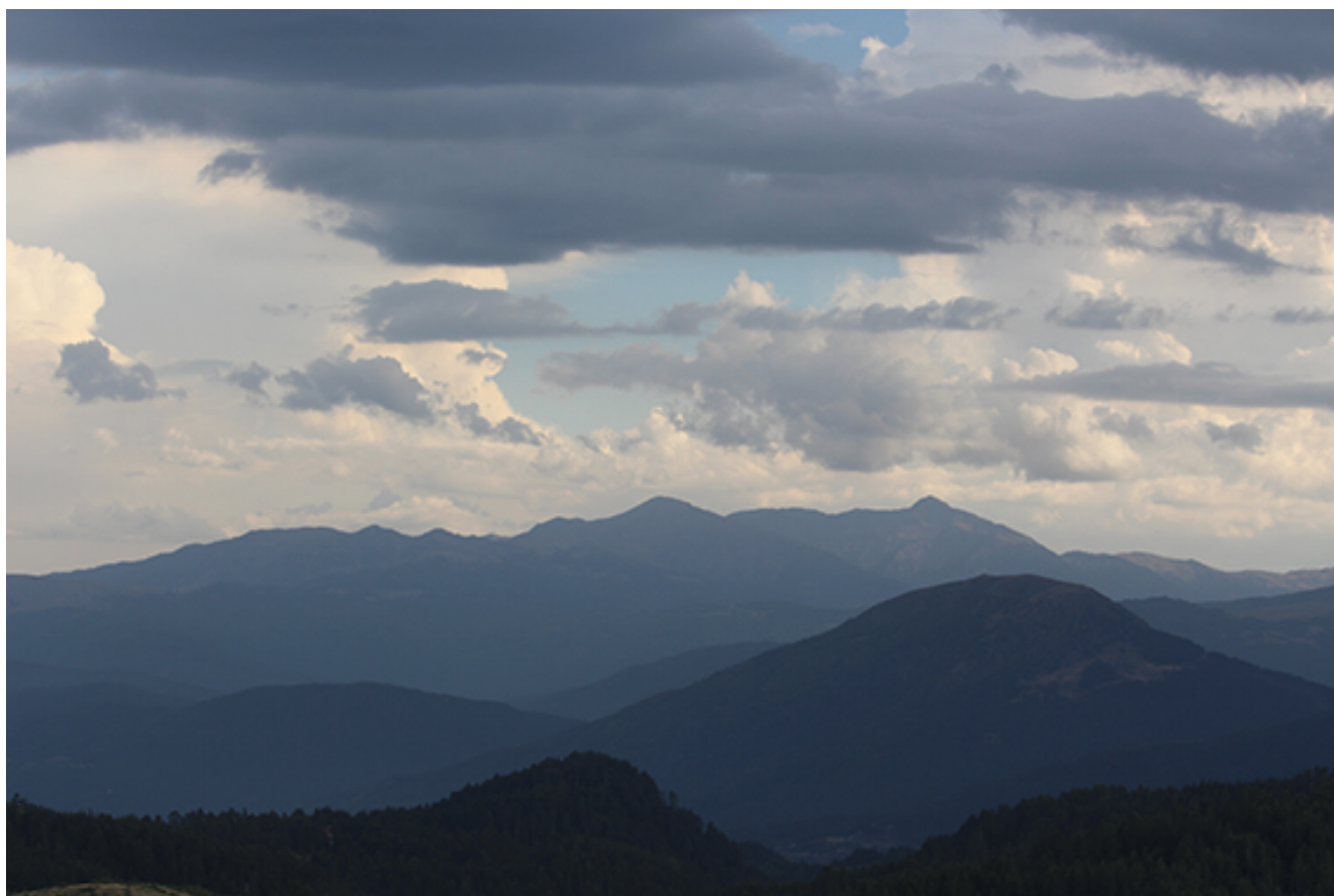
Κορυφές του Γράμμου στα ελληνοαλβανικά Σύνορα, (φώτο Γιάννης Ζιώγας)

Γράμμος: Ο Μεγάλος Ελιγμός, 24 έως 28 Αυγούστου 2018