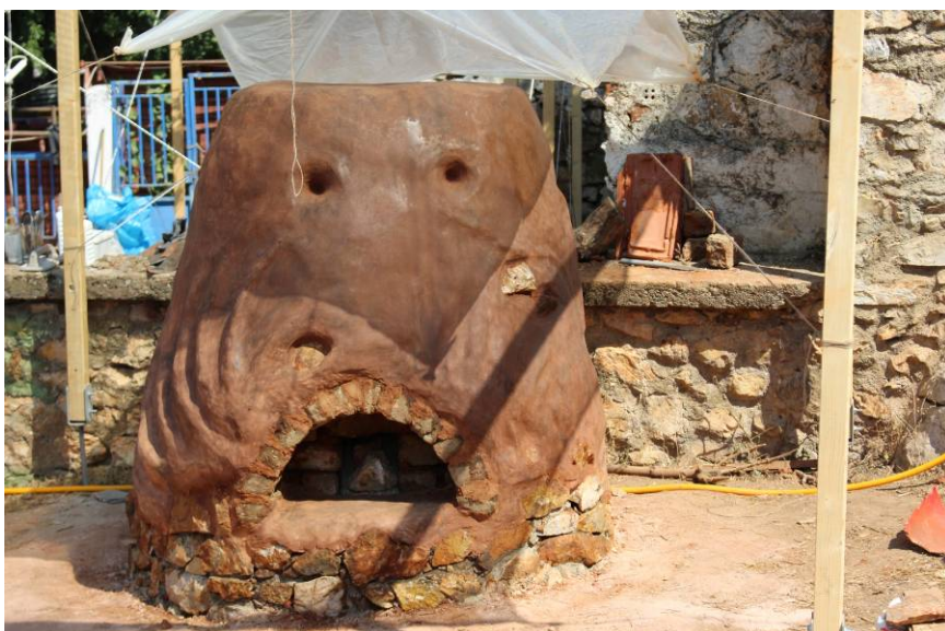
Φύση/όρια/υλικά II του 2016. Ο φούρνος για τα κεραμικά

Θα γίνουν δεκτοί έως 20 συμμετέχοντες ανά δράση . Σε περίπτωση που οι ενδιαφερόμενοι είναι περισσότεροι θα υπάρξει διαδικασία επιλογής με συνέντευξη όπου θεωρηθεί αναγκαία