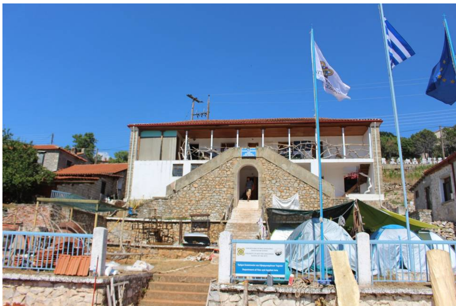
Ο Σταθμός του TEET στους Ψαράδες, τόπος διεξαγωγής της διαδικασίας