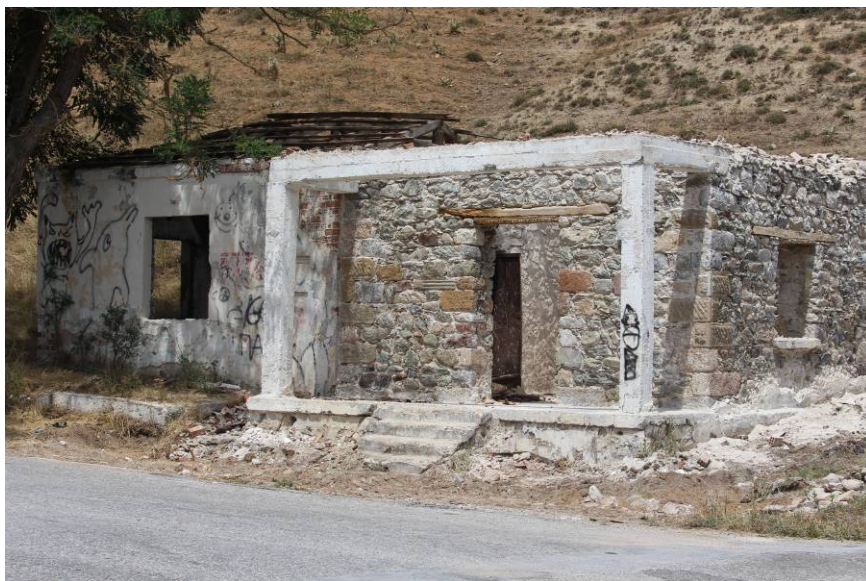
Φυλάκιο στο Λαδοπόταμο, Τόπος διεξαγωγής της διαδικασίας Αύγουστος 2017, μετά την υδροβολή

-ΖΙΩΓΑΣ Γιάννης (επιμέλεια), κατάλογος έκθεσης Εικαστική Πορεία προς τις Πρέσπες 2007-2014, Μια διαδικασία βίωσης του τοπίου, Κρατικό Μουσείο Σύγχρονης Τέχνης, Θεσσαλονίκη, σ. 69-83, 2015.