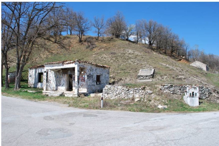
Φυλάκιο στο Λαδοπόταμο, Τόπος διεξαγωγής της διαδικασίας Αύγουστος 2016

Οι διαδικασίες θα ολοκληρωθούν με ένα Διεθνές Συνέδριο για το Μνημείο (ημερομηνίες θα ανακοινωθούν)