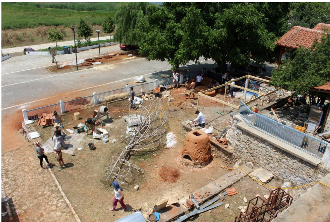
Στιγμιότυπο από το φύση/όρια/υλικά II του 2016. Το συνεργείο σε πλήρη ανάπτυξη

Το πρώτο δεκαήμερο του Ιουλίου 2018 (1 έως 8 Ιουλίου) θα πραγματοποιηθεί στο Σταθμό των Ψαράδων η διαδικασία φύση/όρια/υλικά IV .